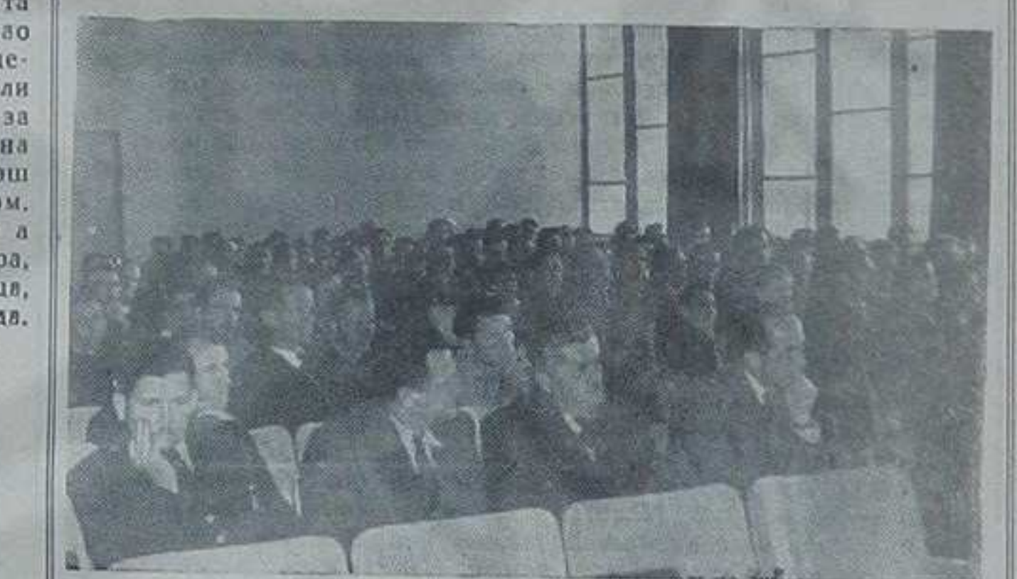
Конференцији је присуствовало 135 делегата