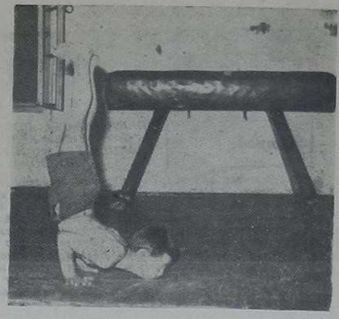
У центру пажње Јавна смотра ДТВ „Партизана“

ЛИСТ ЗА ДРУШТВЕНА И ПОЛИТИЧКА ПИТАЊА КРАЉЕВАЧКОГ СРЕЗА