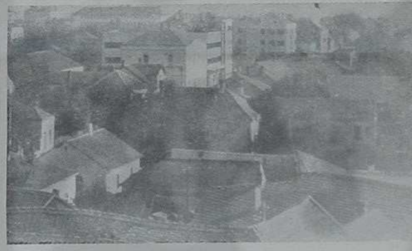
ПОГЛЕД НА ЈЕДАН ДЕО КРАЉЕВА