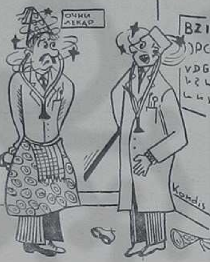
Одмах сам знао, колегинице, да су вам потребне наочари