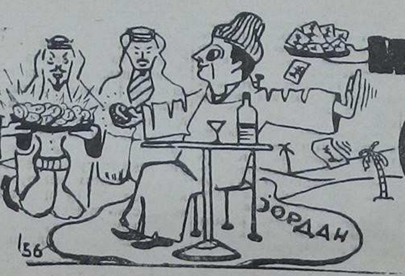
— Нека, хвала, ми више волимо наша домаћа јела.