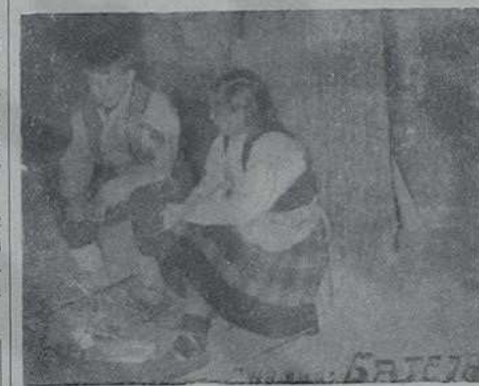
Велики број најмлађих учесника у раду драматичке сцене при Народном позоришту

Истиче се да ће на скупштини бити подељене награде, дипломе и похвале са прошлогодишњег фестивала.