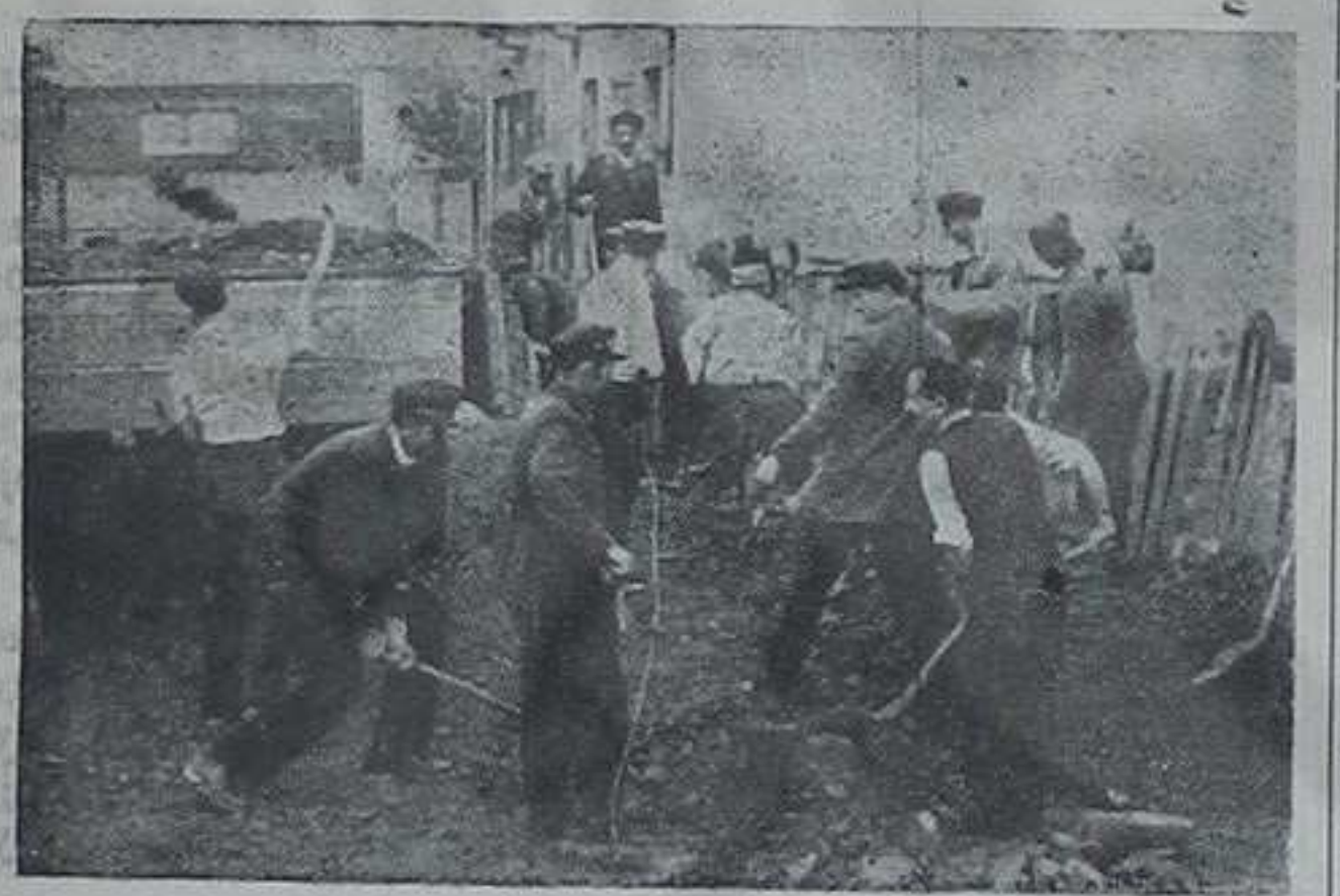
Чланови ССРН на акцији уређења града

После стварања новог комуналног система на територији нове општине Краљево ради деветнаест основних организација Социјалистичког савеза у којима је обухваћено десет хиљада грађана. Иако се ове организације још нису у потпуности ослободиле стереотипног рада, нарочито у појединим мањим селима, оне су у целини показале видан напредак и одиграле крупну