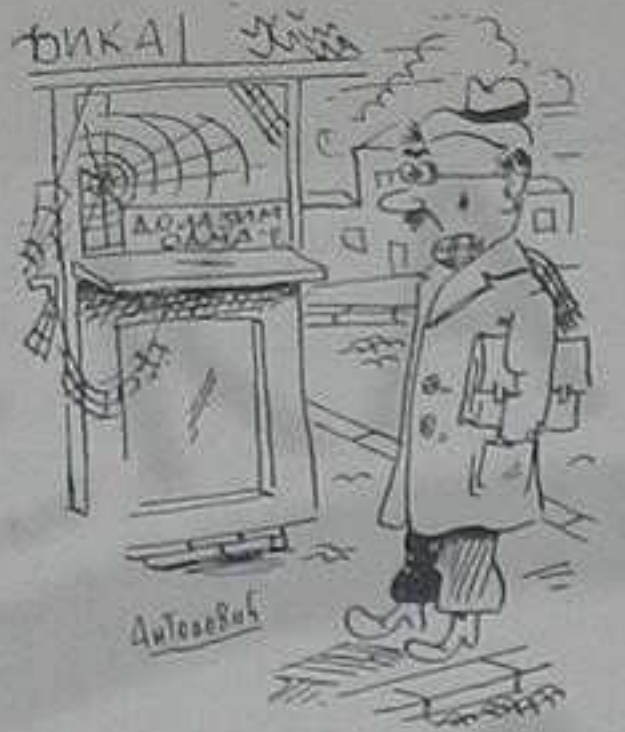
Честа слика и у нашем граду.