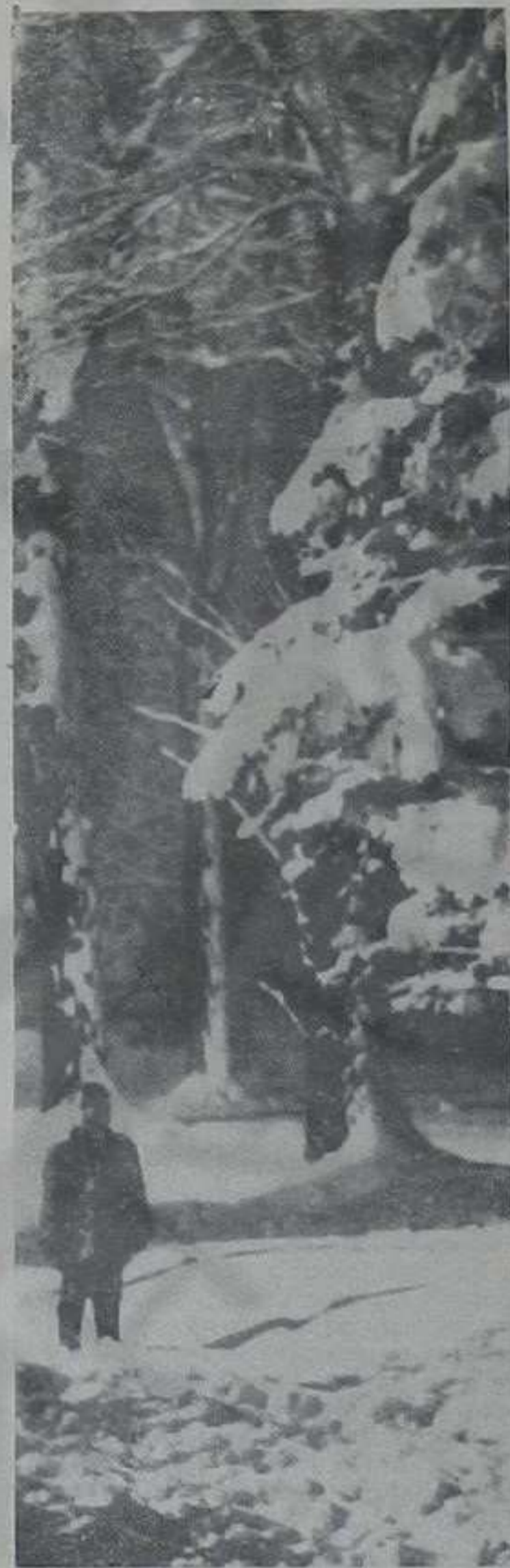
ДЕЦИ ЈЕ СНЕГ ДОНЕО РАДОСТ