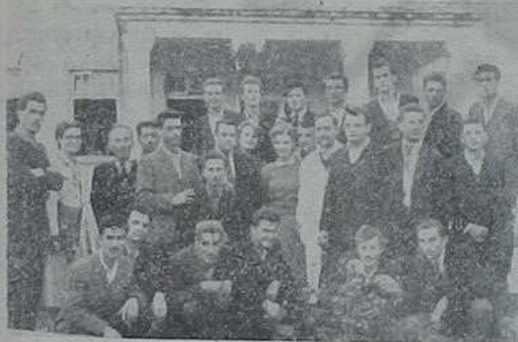
Приликом посете Јевној болници у Бањи Ковилачи, радници овог колектива Фабрике вагона из Краљева, предали су своје поклоне болесницима.

дилишта Бранку Богдановићу, са успехом су читани цртежи који су били компликованији од оних у фабрици вагона. Треба за ову практичну корист коју су радници од семинара имали истаћи и