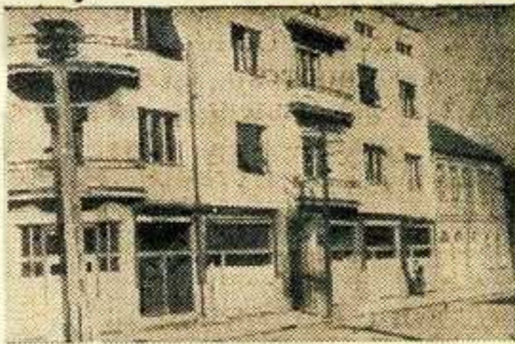
И на територији среза наплата заостаје

Приватна занимања у граду остварују приличне приходе а баш они слабо извршавају своје обавезе и поред тога што су благовремено добили опомене од органа који врше разрез, Па ка-