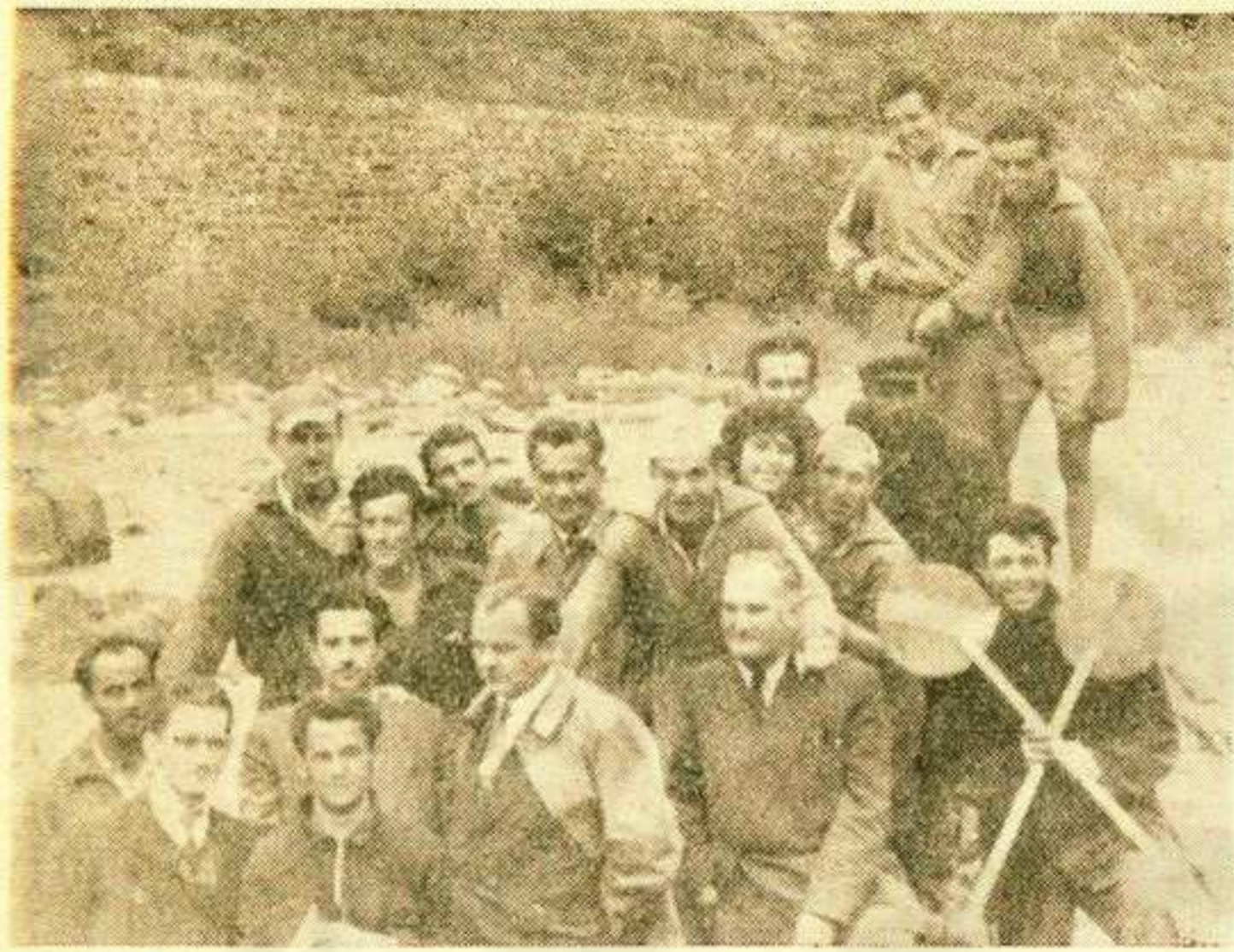
Група наших [кајакаша]