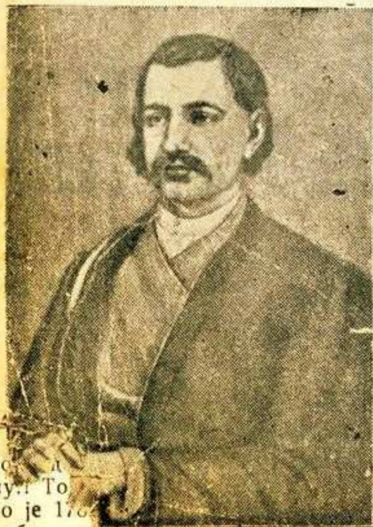
На слици: Јова Курсула — прослављени јунак и мејданџија из Првог Српског устанка, родом из Цвешака у Жичком срезу, где је умро и сахрањен, после рањавања у бишкама проишву Турака