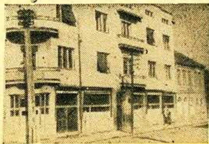
Зграда Народног одбора среза

— Дарвин је утврдио да природна селекција проистиче из суруве борбе за опстанак, између врста, као и појединих индивидуа. Животиње способније прилагођавању условима спољне средине остају живе и с особне у даљем размножавању, а слабије су немилосрдно елиминисане.