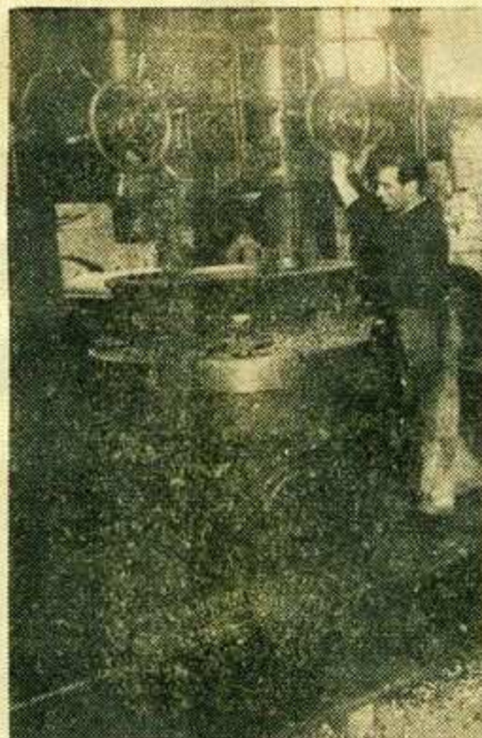
Рад на машини

ни, обновљених старих кола и ових која се обнављају и друге серије вагона за Колубарске руд-