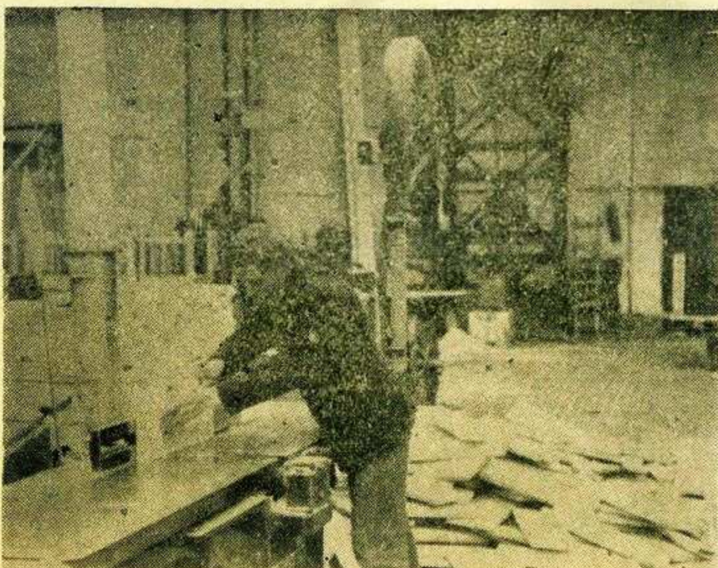
Из Фабрике вагона