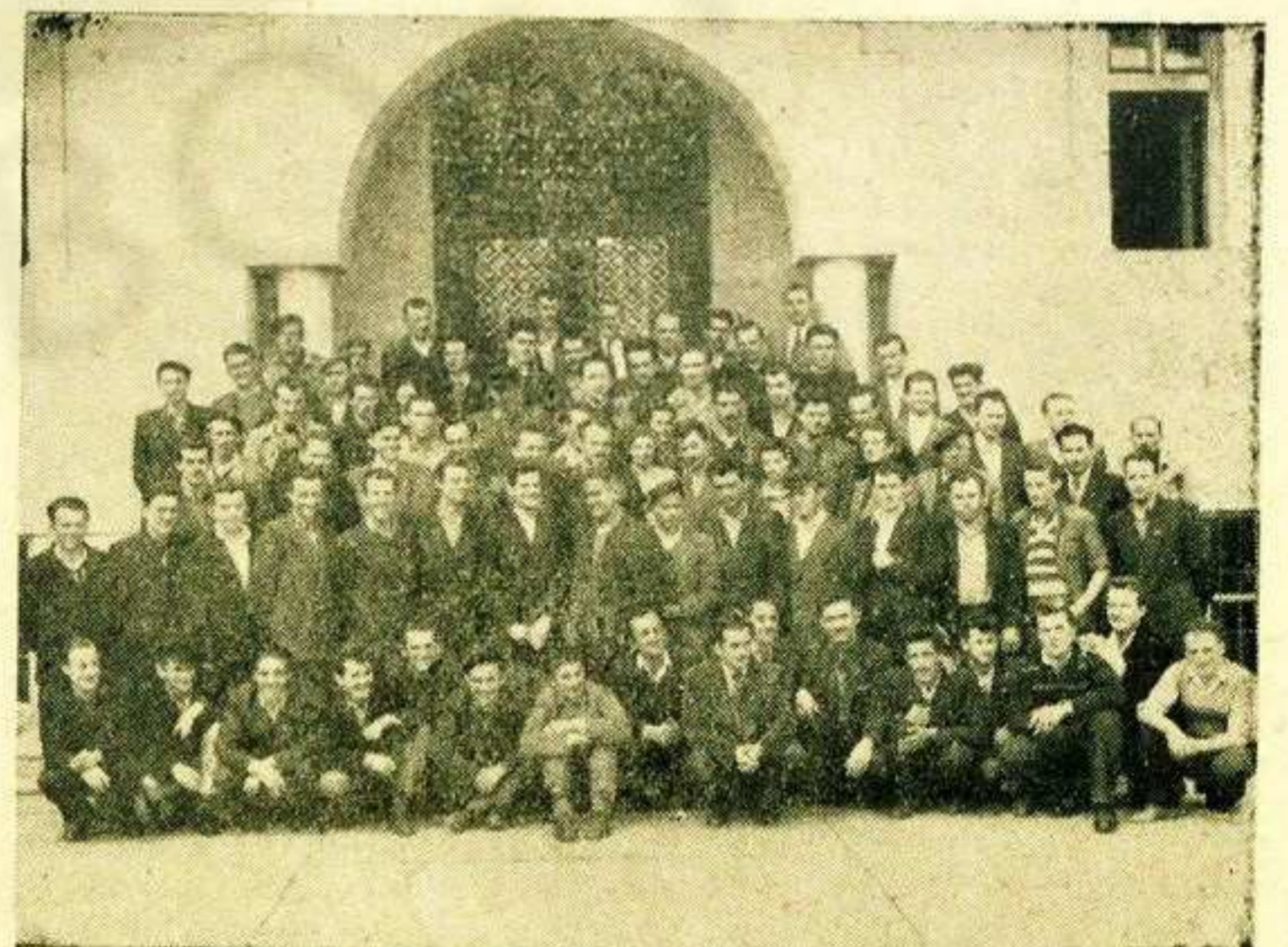
Раднички савет Фабрике вагона