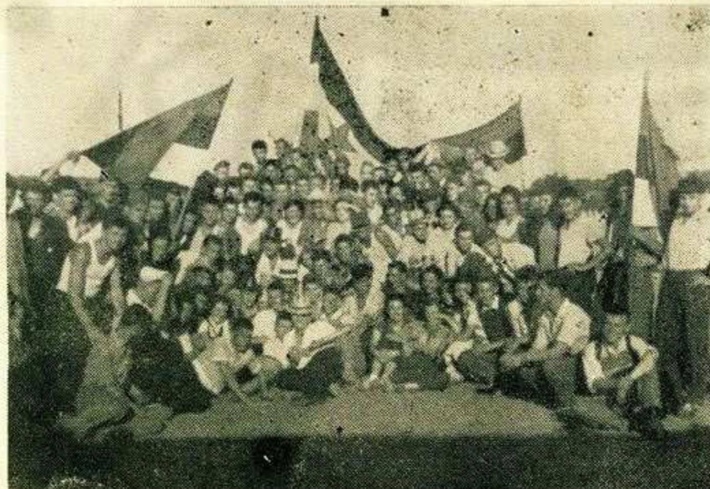
Омладинска бригада на изградњи Фабрике каблова у Светозареву

У једном од каснијих бројева нашега листа донећемо и репортажу са радилишта и логора наше бригаде.