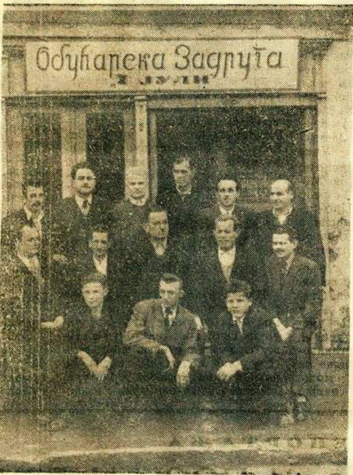
КОЛЕКТИВ ОБУЋАРСКЕ ЗАДРУГЕ