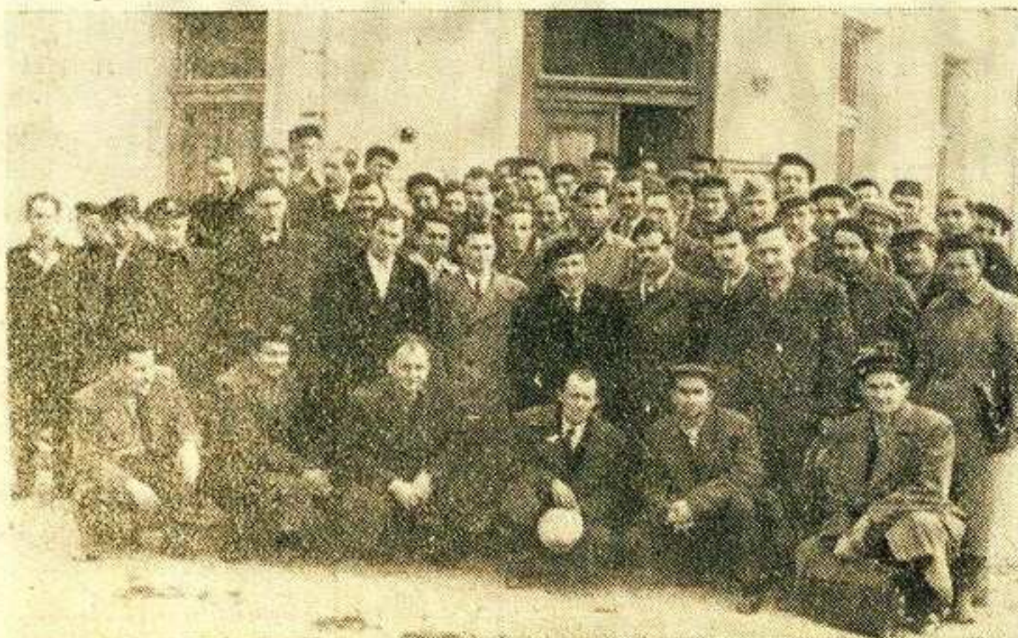
Чланови иленима Среског синдикалног већа у Краљеву после једног од својих сасстанака

За овакве успехе задруге носе заслугу у првом реду службеници исте за што су им и управни одбор и скупштина, одржана ових дана, одали пуно признање.