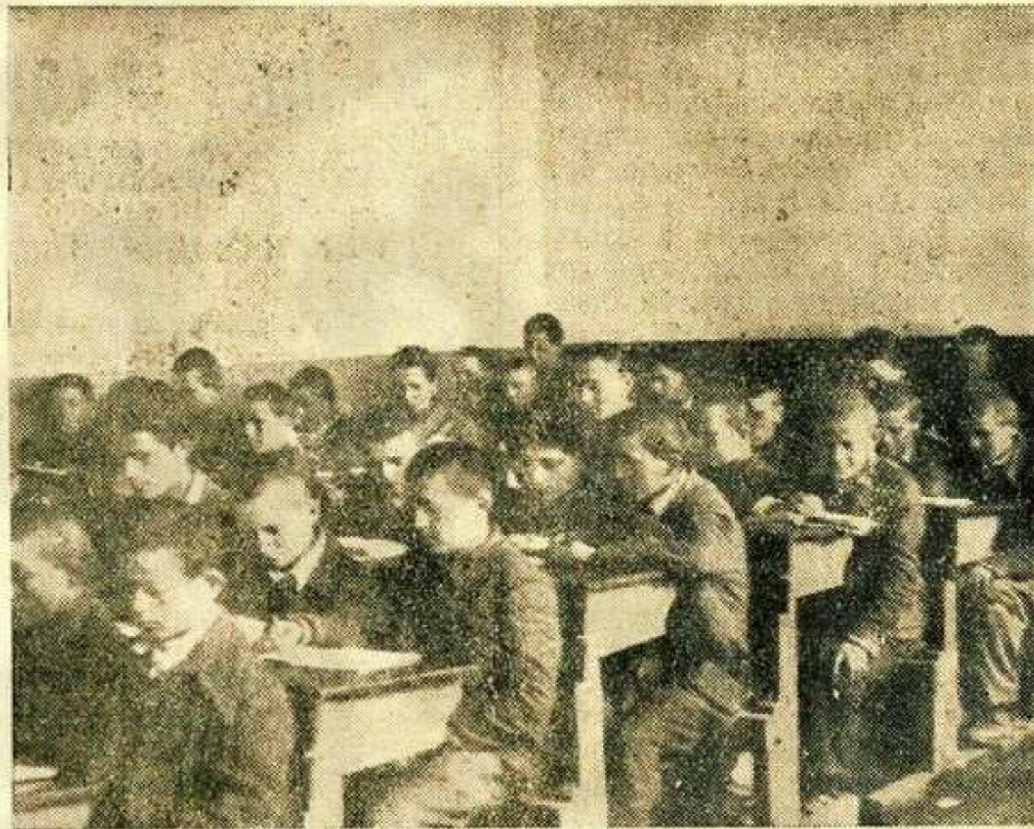
Из дана у дан ученика је све више, а школски простор све мањи... проблем који се мора што пре решити.