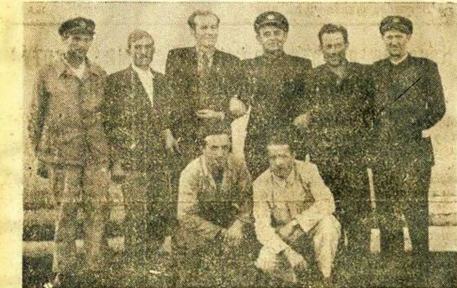
УПРАВНИ ОДБОР ЖЕЛЕЗНИЧКЕ ЛОЖИОНИЦЕ

Управни одбор би, као извршни орган радничког савета, примао на себе изналажење најбољег начина за спровођење одлука радничког савета.