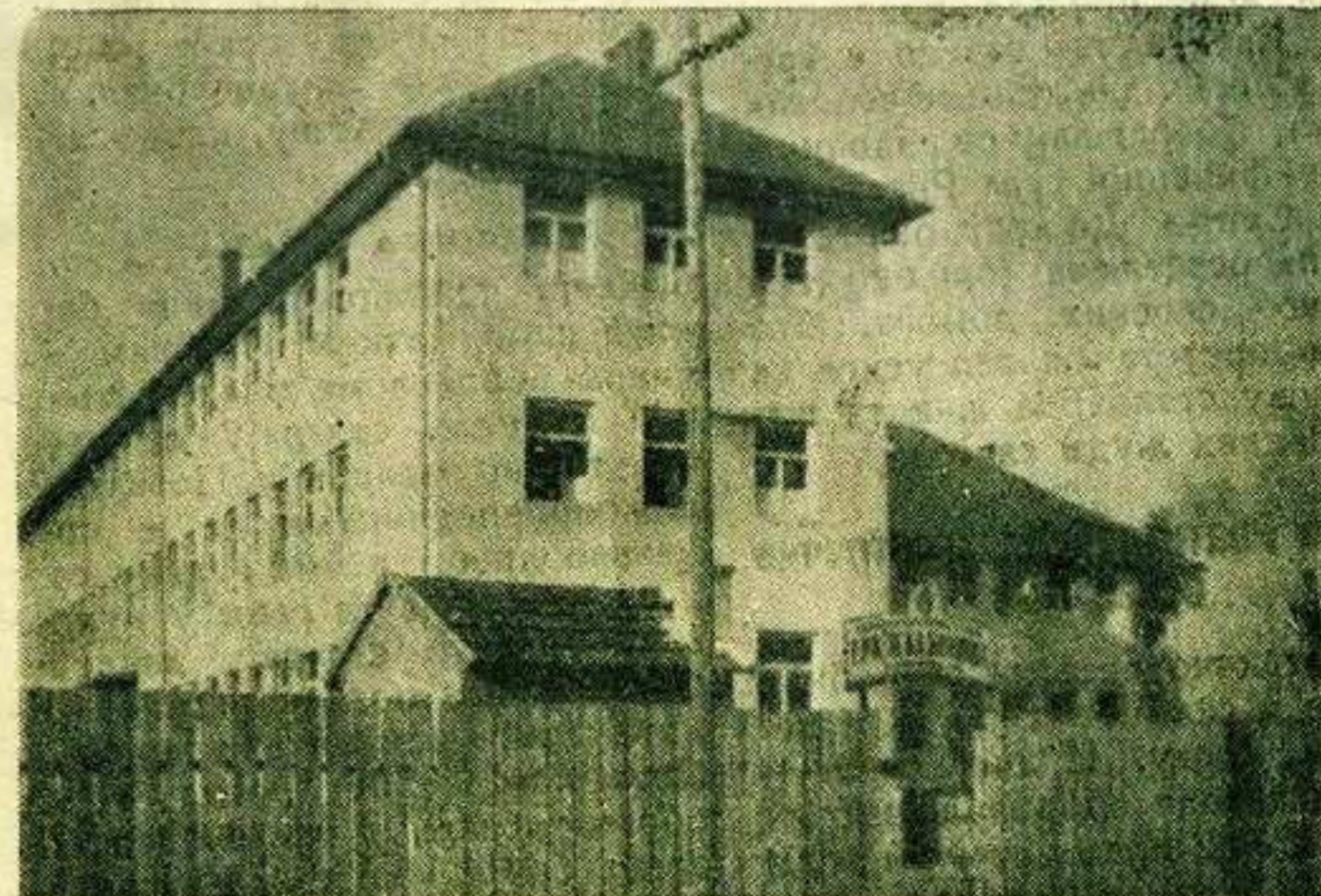
Садашња зграда болнице која не одговара потребама

Преласком у зграду Завода за социјално осигурање, болница се проширила и добила нова одељења и то: хирушко, гинеколошко, интерно и дејче, док је постојеће разино одељење оста-