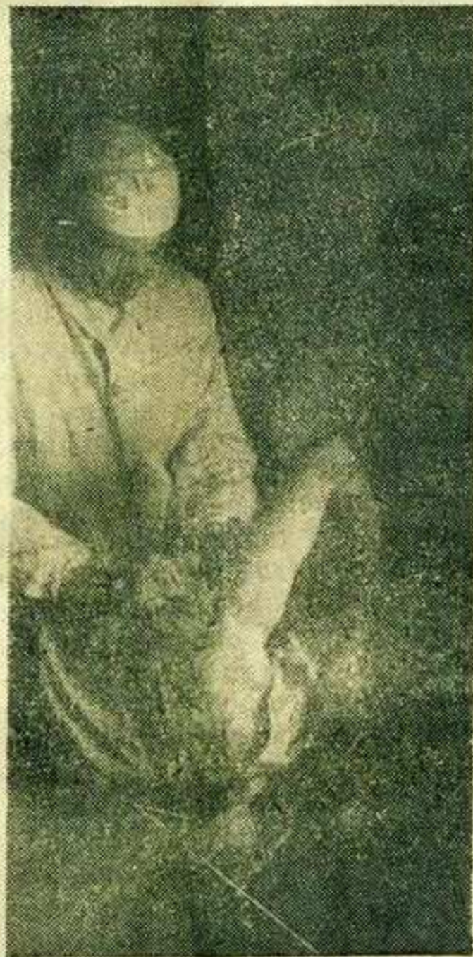
Из Антитуберкулозног диспанзера

треба да има јак медицински центар, поготову што и нова магистрала која ће везивати северни део са јужним пролази поред Ранковићево, затим рудна богатства овога краја, створиће већу ек-