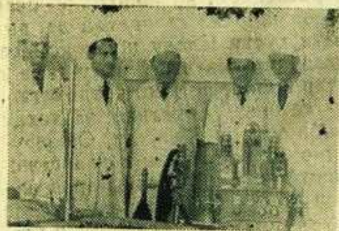
Група медицинских радника

град у близини две чувене бање Врњачке и Матарушке итд. нема своју зграду болнице већ је она смештена у згради Државног завода за социјално осигурање, која не одговара потребама једне веће болнице. Док се болница налазила у згради Основне школе, у њој је само указивана хитна лекарака помоћ, а о неком систематском лечењу није се могло ни помислити.