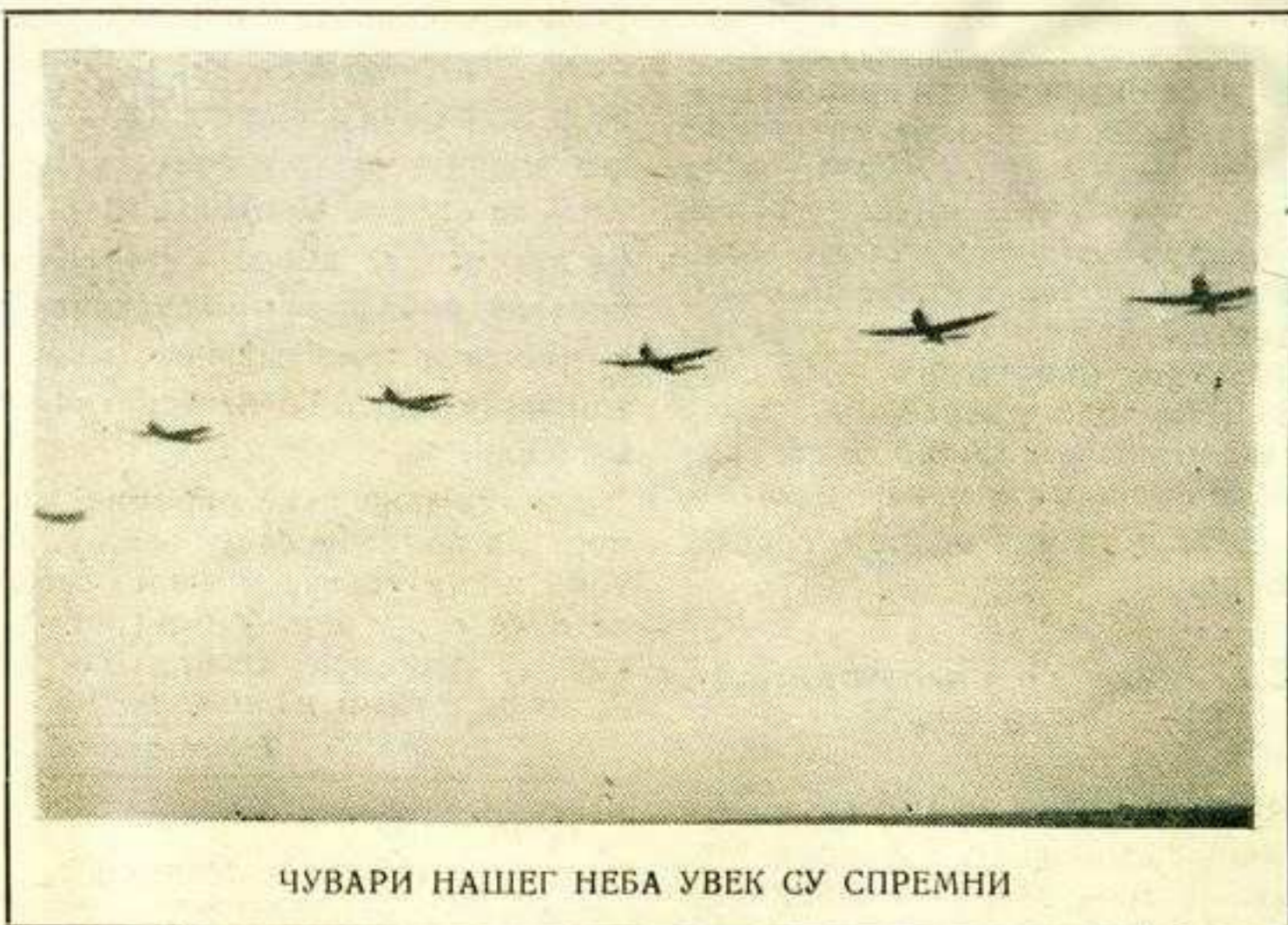
ЧУВАРИ НАШЕГ НЕБА УВЕК СУ СПРЕМНИ

У следећем броју нашега листа после одлуке Народног одбора Градске општине даћемо већи коментар у вези ове одлуке са ближацима објашњењима, како би читаоци нашега листа били информисани о овом важном питању.