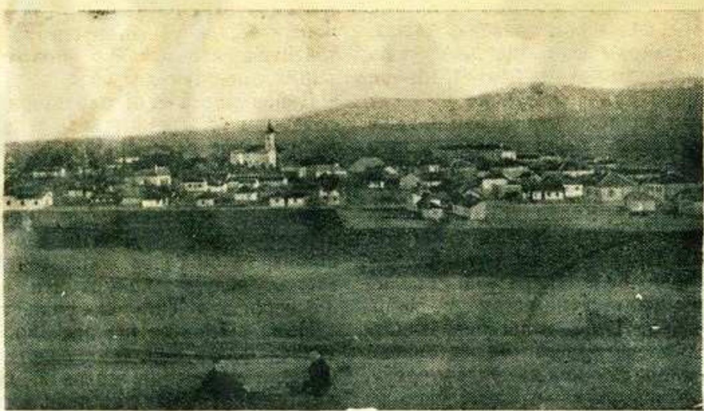
ИЗГЛЕД СТАРОГ КРАЉЕВА

Улазнице се могу добити у распродаји и на каси.