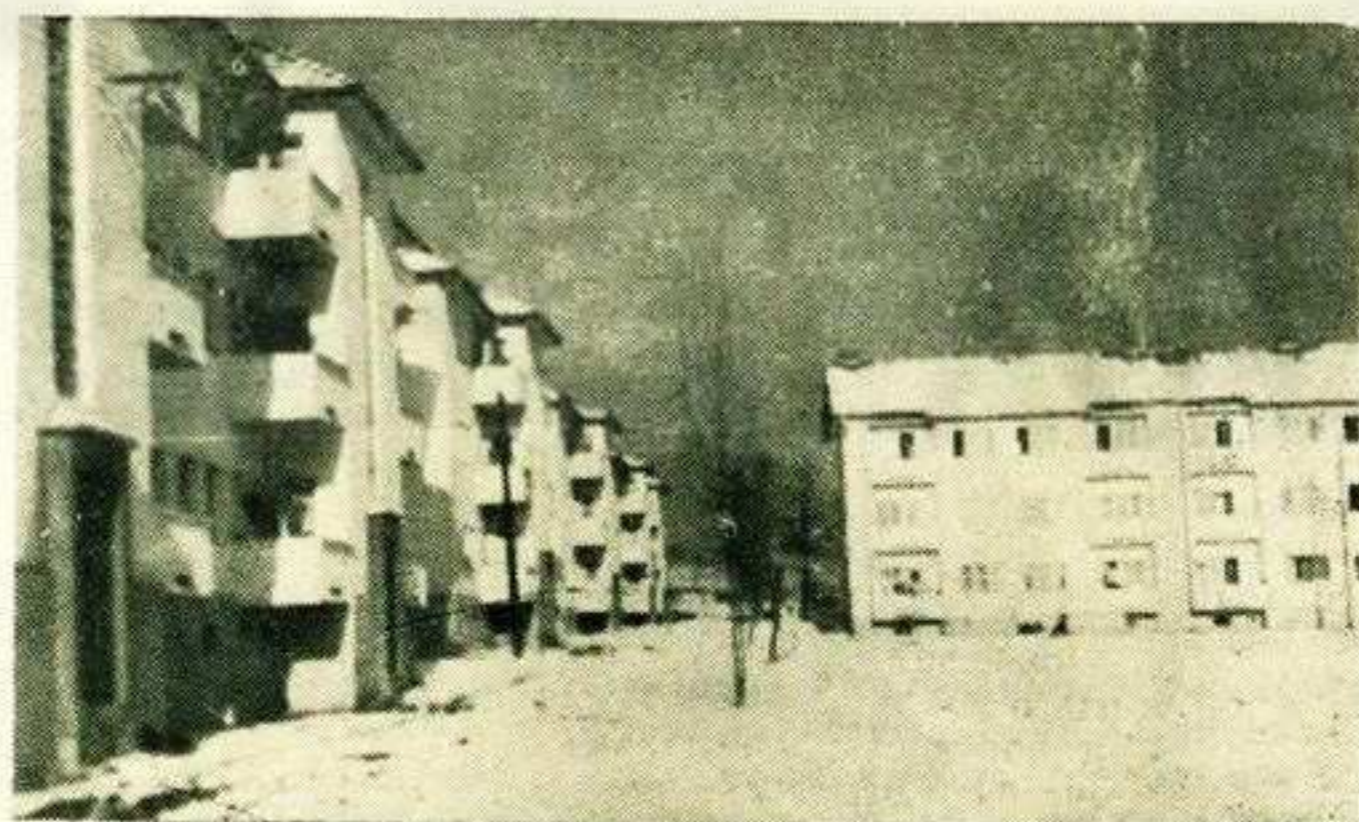
И поред већег броја подигнутих станбених зграда у прошлој години станбено питање у граду није решено