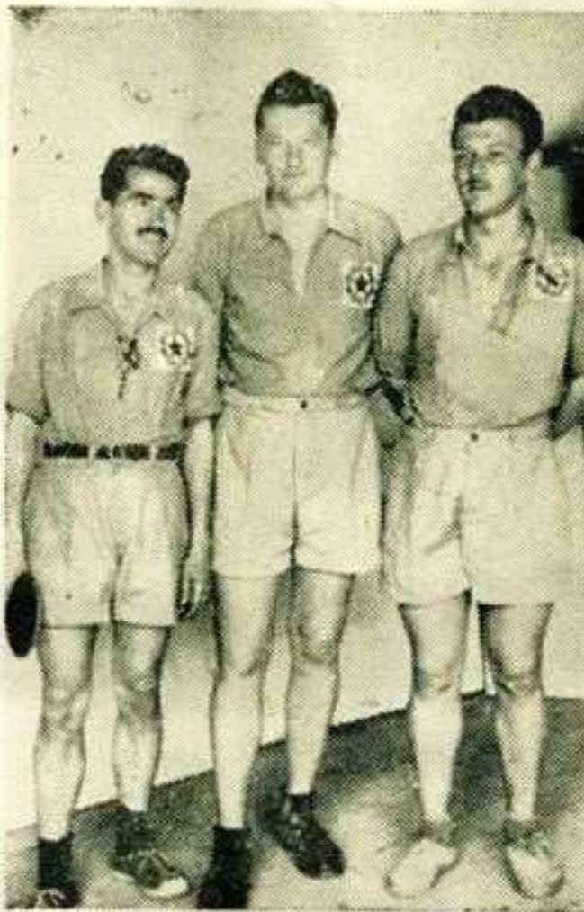
Екипа стонотенисера Металца