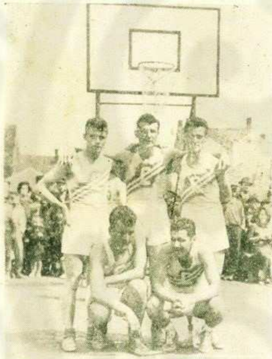
Екипа Слоге која је освојила пехар победивши све своје противнике:

Ретка су утакмице као што је била финална Слога - Шумадија. Ретка су и таква узбуђења, обрти и догађаји на терену као што су били овог пута. Ни најхладнокрвнији не би издржао мирно утакмицу до краја. Финале су пружиле највећу драж кошарке и најтеже је било гледаоцима који не памте да су икада посматрали овакво узбудљиво спортско такмичење. Фудбалска узбуђења су исувише мала према оваквом. А било је као у паклу. Брујало је са свих страна, од навијања се ништа није чуло. Плескало се и навијало се, звиждали су судијама, час се радовали, час ломили прсте од муке, све у великом узбуђењу и све док судије нису отсвирале крај. И почетак је био узбудљив. Шумадија је повела, Слога је изједначила, па повела, па опет нерешено и тако се резултат стално кретао. Кошеви су наизменично падали сваки час, и полувреме нерешено 20:20. Играо се „пресинг“. Играчи су се борили за лопту која је већ изгледала изгубљена.