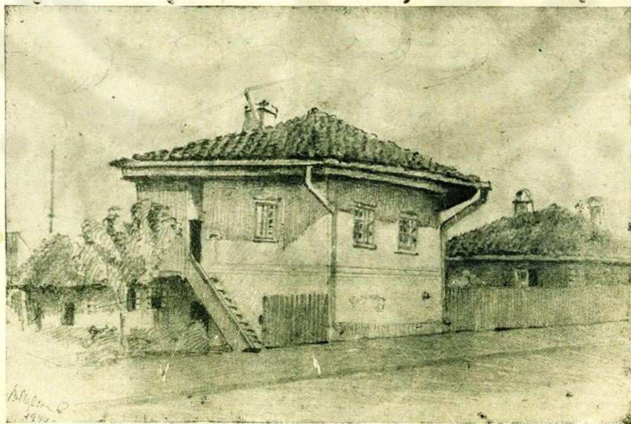
Једна од најстаријих кућа у улици Цара Лазара срушена је прошле године и на месту ње подиже се дијана зграда дирекције „Стотекс“—а. Слика је: рад сликара Марјика из Ранковића.