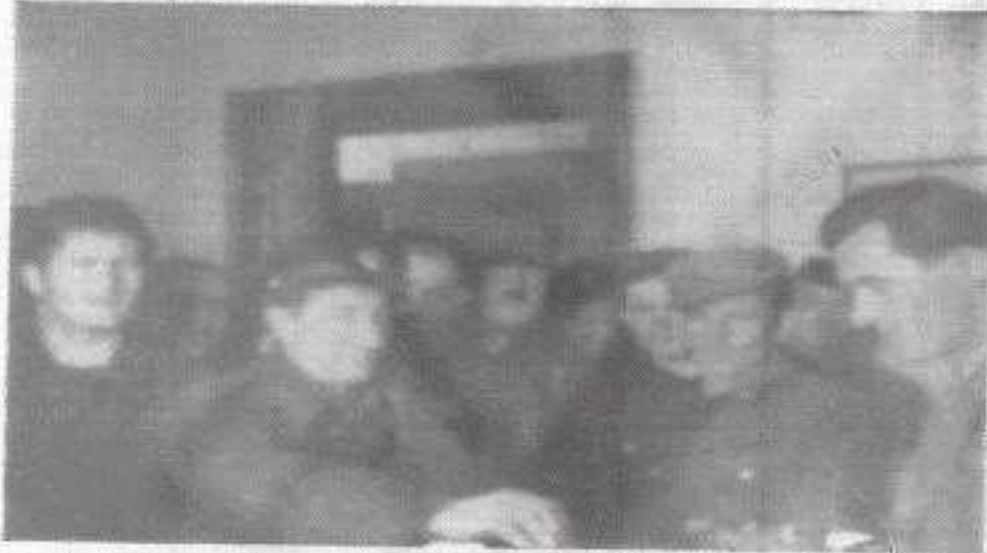
Са једног изборног места у Железничком чвору