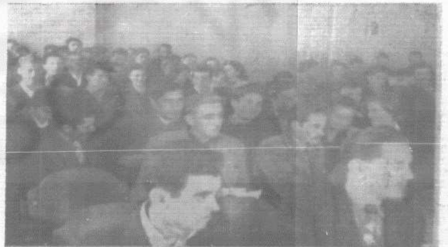
Са IX Градске конференције Народне омладине

За наредних десет година предвиђају се огромна инвестициона средства за унапређење пољопривредне производње, која ће се утрошити за механизацију, наводњавање, производњу вештачких ђубрива, подизање пољопривредне прерађивачке индустрије итд., што ће све у знатној мери утицати на подизање животног стандарда.