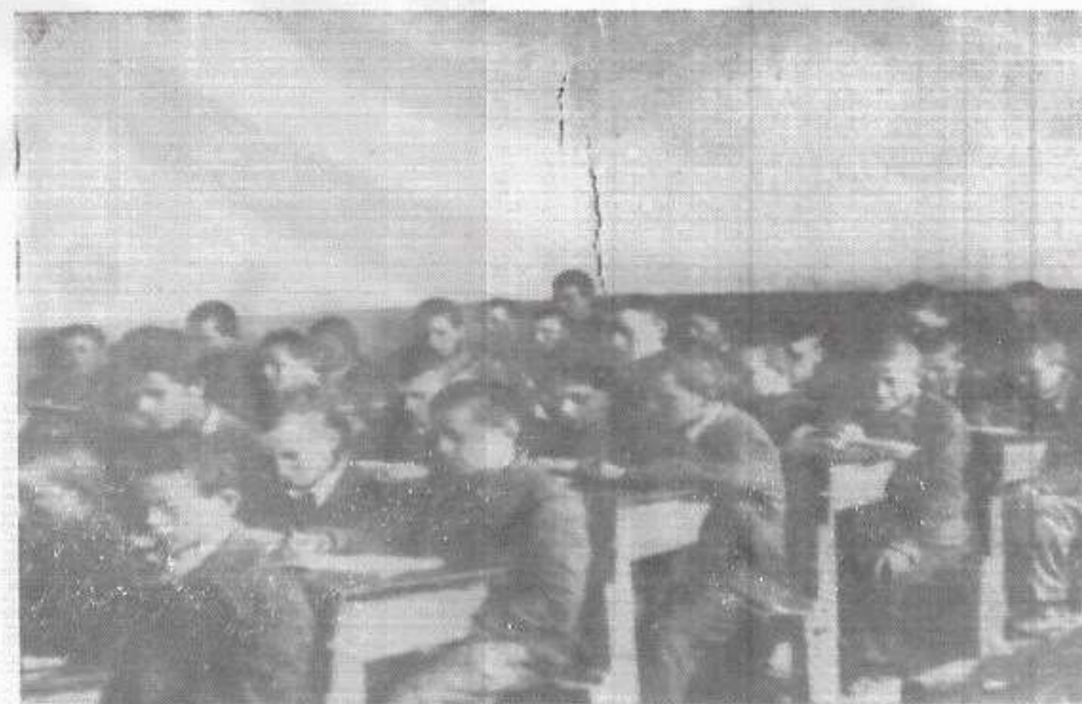
После летњег распуста у нашим школама почео је рад