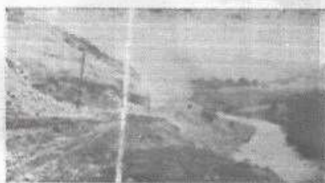
Пут за Каменицу у изградњи

Из овога се види да задругари Каменице воде добро своје пословање и да ће с обзиром на оно што су замислили, задруга и даље јачати и развијати се, те тиме служити за пример осталим селима у срезу.