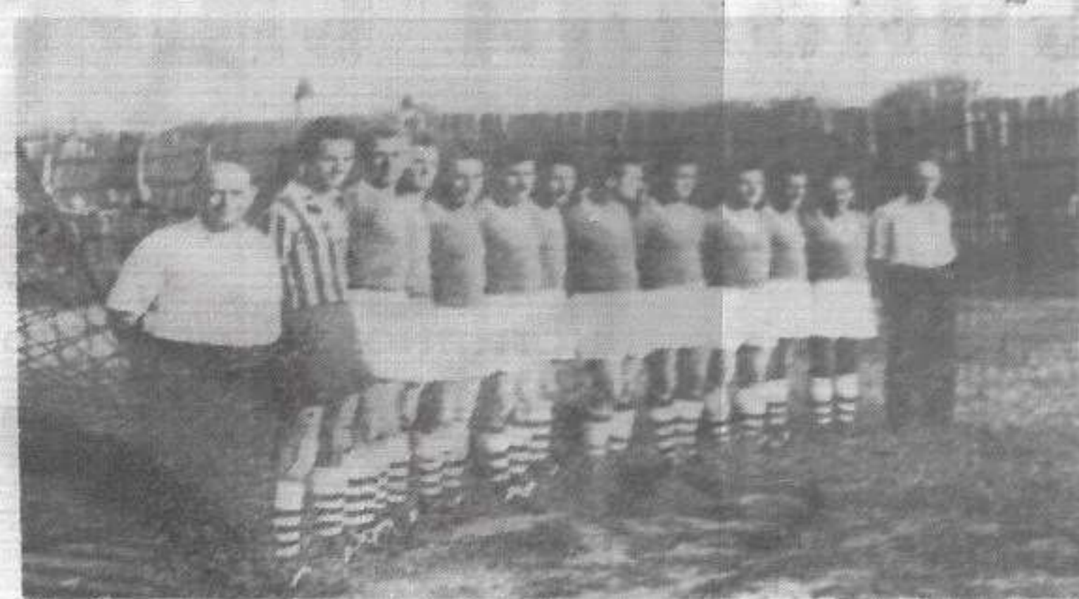
Футбалски тим Слога