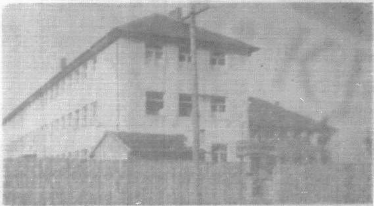
Зграда болнице у којој је смештена и зубна амбуланта